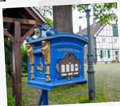
IN BERGNEUSTADT PAST DE KRUISISCHE POSTBRIEFKASTEN IN HET PLATJE.

OP WANDEL IN DE OMGEVING VAN DE BEVERTALSPERRE.