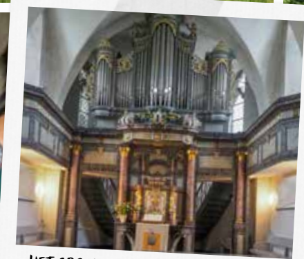
HET ORGEL IN DE EVANGELISCHE KERK IN BERGNEUSTADT